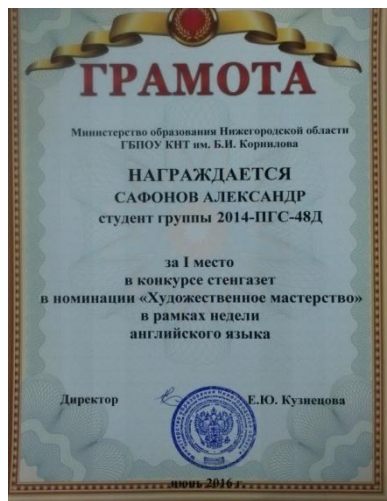
За художественное мастерство "LONDON"