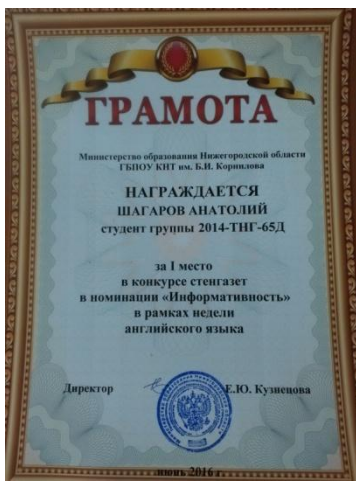
За информативность "GREAT BRITAIN"