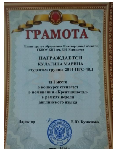
За креативность "FAST FOOD"